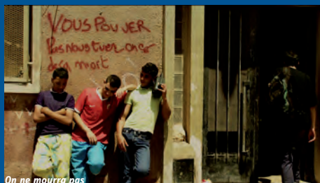
On ne mourra pas