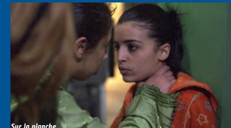
Sur la planche

EN PRÉSENCE DE LA RÉALISATRICE (sous réserve)