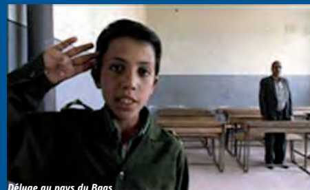
Déluge au pays du Baas