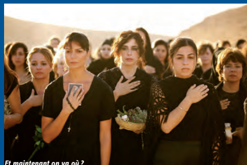
Et maintenant on va où ?

Notre idée de départ était de montrer tant les films réalisés pendant et sur la Révolution que ceux qui l'annonçaient. Chemin faisant, nous avons réalisé combien un recul est nécessaire aux cinéastes pour construire leurs films sur la Révolution. Ce constat nous a conduit à établir une programmation qui met en valeur une diversité d'expressions filmiques. Dans la sélection, se sont télescopés les témoignages bruts de la réalité et la mise en scène artistique de ces événements forts de l'histoire, mais tous reflètent une dynamique chargée de sens, voire de poésie.